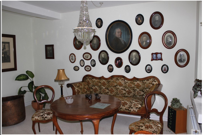
En række af Storgaardslægtens aner på væggen i stuen på Hinge Storgård

Storgaardslægten har i en lang årrække haft fornøjelsen af at besøge slægtsgården blandt andet til de mange slægtsstævner, hvor dørene altid har stået åbne til at modtage besøg. Vi har kunnet nyde synet af den flotte