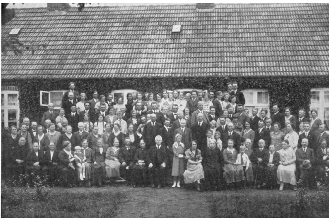
Storgaard slægtsfest 1933 på Hinge Storgaard

Der vil blive udsendt endelig indbydelse i foråret, når programmet er færdiggjort.