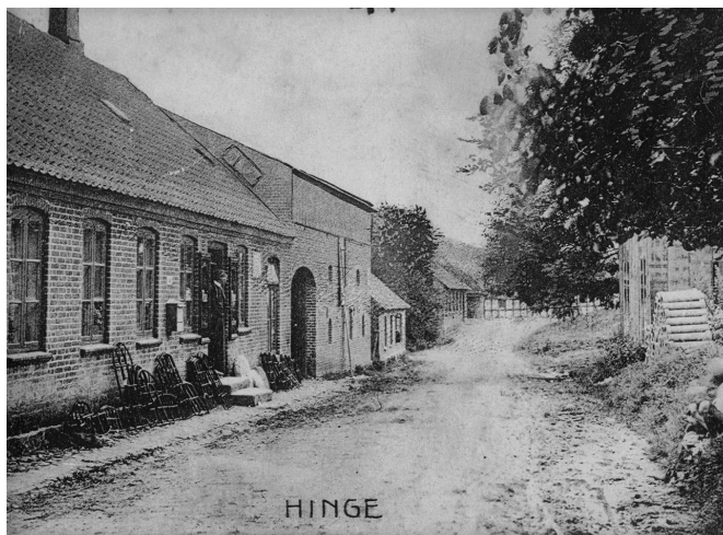
Hinge købmandsgård og Storgaard i baggrunden før branden i 1926