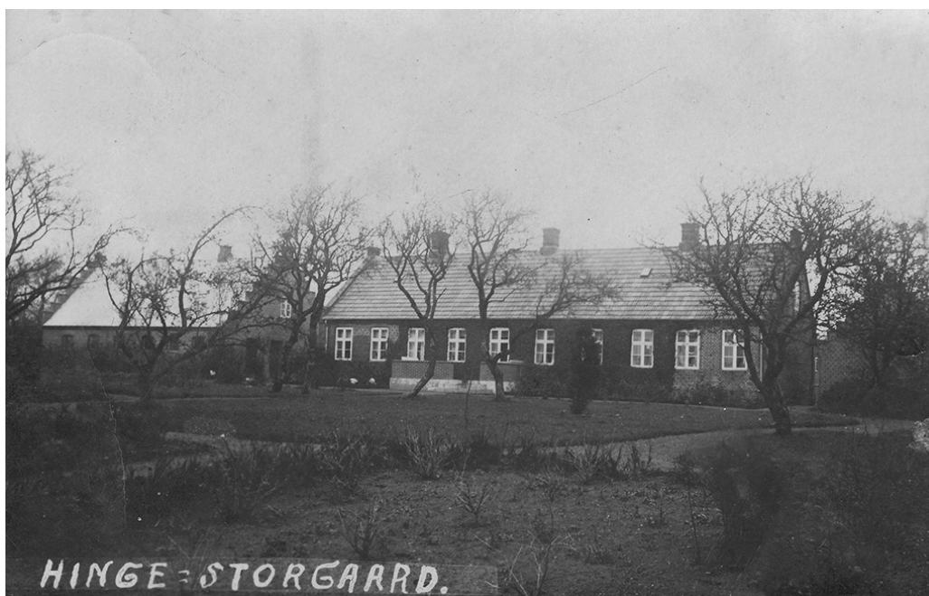
Hinge Storgaard 1922