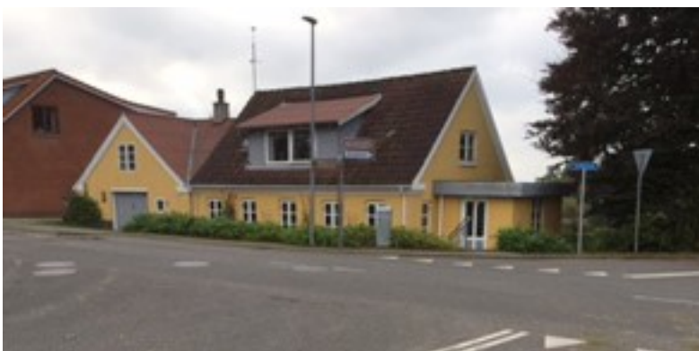
Nørskovlundvej 34 i dag