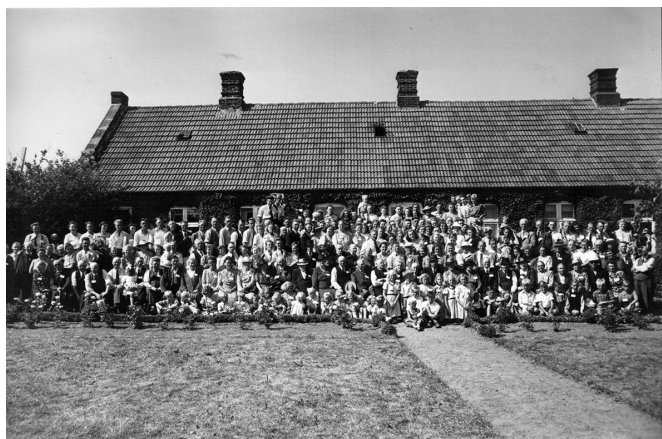
Slægtsfesten i 1947 (se stort billede på hjemmesiden)

udsigten over Hinge Sø inden kaffe og kage serveres i teltet, når alle har været til gruppefotografering foran stuehuset (som de også gjorde i 1947).