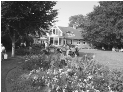
Et parti af haven på Hinge Storgaard (2005)