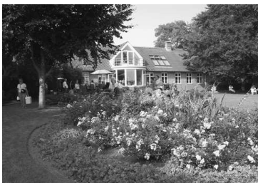
Haveparti på Storgaard år 2005